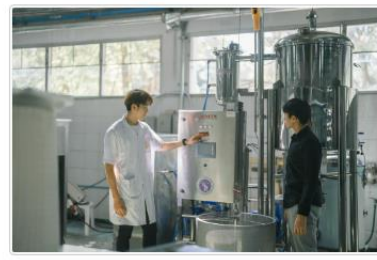
ผู้ประกอบการ/ผู้ให้บริการ