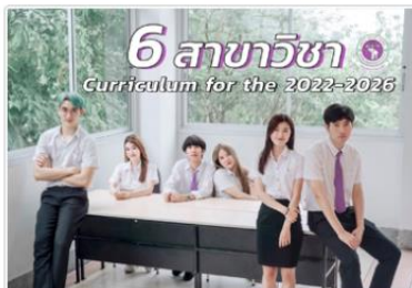
ผู้สนใจศึกษา