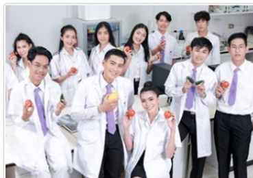
นักศึกษาปัจจุบัน