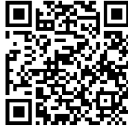
สแกนกรอกข้อมูล

1. ค่าธรรมเนียมการสมัคร 100.- บาท (หนึ่งร้อยบาท) ต่อคน โดยสแกนกรอกข้อมูล ชื่อ-สกุล และอีเมล เพื่อแจ้งรายละเอียดการชำระเงิน